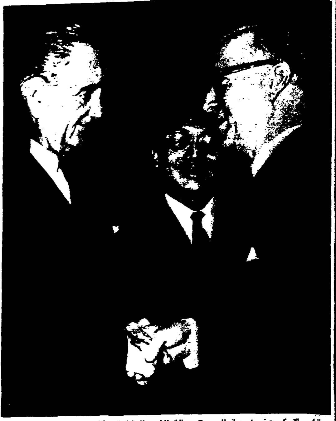
الرئيس التركي جونسون يصاحبه السيد جلوب ملك الجنوب الموليفي لدى الامم المتحدة وقد ظهر بينهما اولئك السكرتير العام للأمم المتحدة كيم ديفيدسون بعد ان التقى الرئيس التركي خطابه في الجمعية العمومية للأمم المتحدة

قررت رئاسة اجراء القرقره تنفيذاً لللائحة الواردة اليها من دائرة اجراء عمان بيع حصص والبالغة 16 ٪ حصة من اصل 87 ٪ حصة من كامل القطعة رقم 49 حوصي رقم 2 هي القطعة الواقعة ضمن حدود بلدية القرقره والذاتي واحاطها احاطة قطعية على الزاود الاخر بالبلد الاخر وقرقره حصة وسبعين ديناراً لوزا يجب عليك خلال نلثة ايام من تاريخ التوقيه في احدى الصحف الخلية مراجحه دائرة اجراء القرقره من اجل تمام معاملة القرقره او نفع المبلغ ويمكس لك تقوم دائرة الجراء بالقرقره بجراء معاملة القرقره وتسجيل القمصى المبيعة على الزاود الاخر بالبلد الاخر وعليه حصر ملور اجراء القرقره